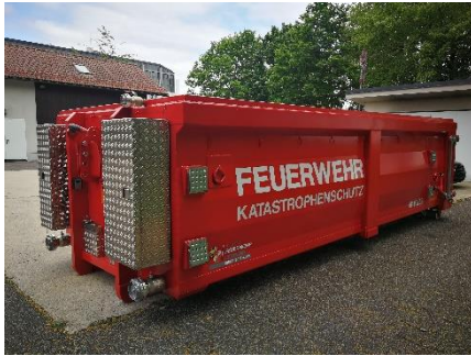
Geräteboxen an der Vorderseite

Einsatztaktische Unterlagen für die Beratung des Einsatzleiters werden mitgeführt, in denen auch die Möglichkeiten für die fachgerechte Entsorgung des kontaminierten Löschwassers enthalten sind.