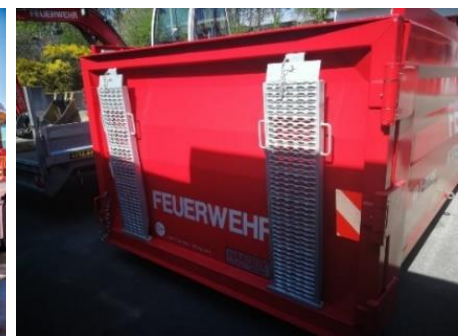
Rückwand, Schwenktür rechts öffnend, inkl. Auffahrschienen