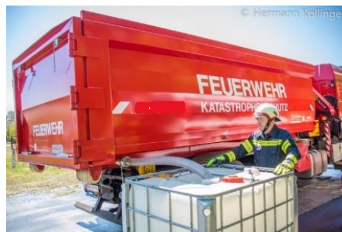
Ablassen von z.B. kontaminiertem Löschwasser in IBC-Behälter