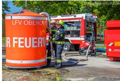
Wasserentnahme über TS