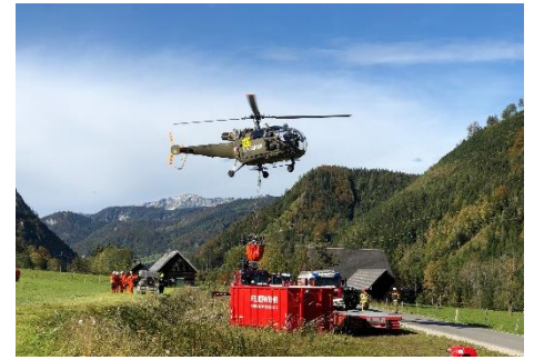
Befüllen durch Hubschrauber